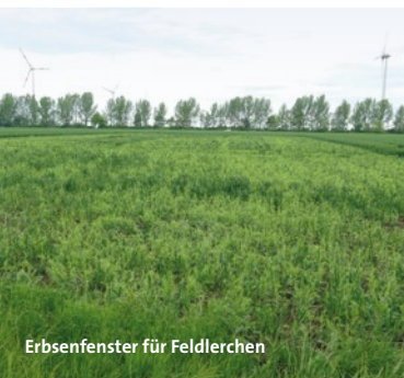
Erbsenfenster für Feldlerchen

Erbsenfenster als Brutplätze für Feldlerchen